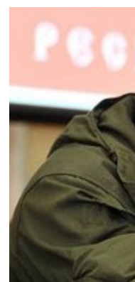
Стали изв факты с п