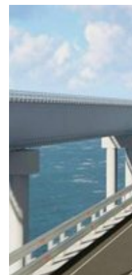
Крымский объект на РосСМИ