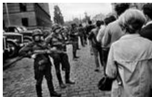
50 лет назад СССР танками задушил «Пражскую весну»